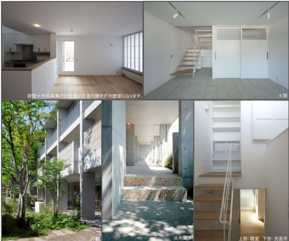
居間*今回募集のお部屋は正面の開き戸が壁面になります。